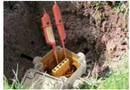
Aquasit ist selbsteinheilend, so dass sich elektrische Verbindungen nach der Installation einfach prüfen lassen.