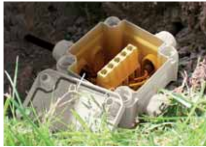
Der vollständig vergossene Kabelabzweigkasten erreicht Schutzart IP68. Die Kabelverschraubungen dienen lediglich der Zugentlastung.