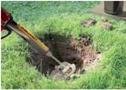
Einfache und saubere Installation: Kartusche einsetzen, vergießen, fertig.